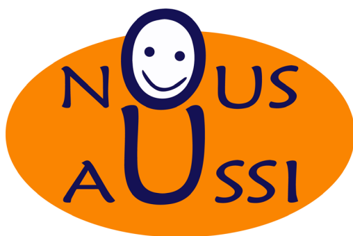
Association française des personnes handicapées intellectuelles

En permettant à chacun de participer à la construction de la vie de la cité et aux personnes en situation de handicap, en tant que citoyens à part entière, de faire entendre leur voix dans l'ensemble des sphères de la société.